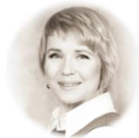
Õpiku autor Eve

WordPressi õpik on loodud eelkõige just algajale. Isegi kui sa pole kunagi pidanud ühtegi veebilehte looma või haldama, saad siit sõnasõnalised juhised, kuidas midagi teha ja mis järjekorras.